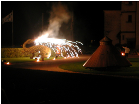
圖 12：安波瓦滋城堡夜間劇的表演畫面之 3