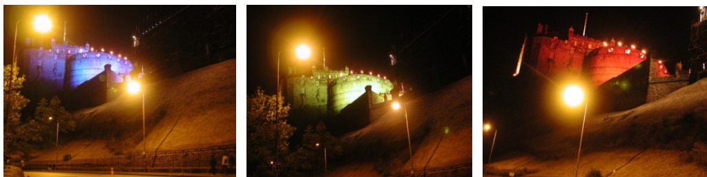
圖 20：千變萬化的愛丁堡軍樂表演之城堡燈光

，只見城堡時而黃、時而綠、時而紅，千變萬化。(圖 20)難怪愛丁堡的軍樂表演一票難求，若非半年前就已購票，還無緣觀賞。