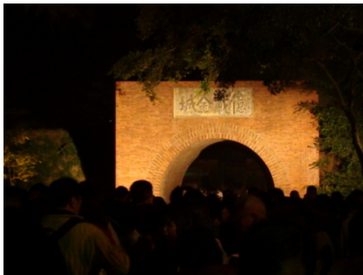
圖 4：引領觀眾的明燈—入口近景