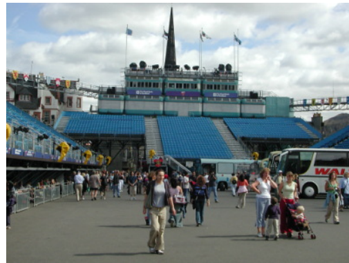
圖 17：愛丁堡城堡軍樂表演置於四周的觀眾席