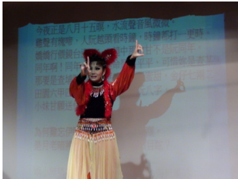
圖 21：秀琴歌劇團於南台 N201 對於「現代歌仔新調的《安平追想曲》」的演示》