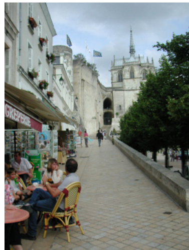
圖 9：安波瓦滋城堡夜間劇的入口

生許多影響法國甚至歐洲的重大歷史事件而聞名。這樣的城堡隨著時間的流逝，年輕世代的觀光客，對於歷史意識的薄弱情況下，就沒有必要特地造訪安波瓦滋城堡，因此該小鎮賴以維生的觀光榮景不再，且逐漸衰退。有見於此，小鎮發起自救會，在全鎮居民的共識之下，決定以羅亞爾河流域著稱的夜間秀來拼觀光，且以原城堡的主人法蘭西斯一世為軸心，推出夜間劇〈Chateau d'Amboise〉。 7 該劇的演出是