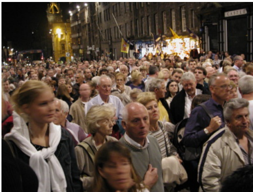
圖 18：由城堡入口入場的觀眾