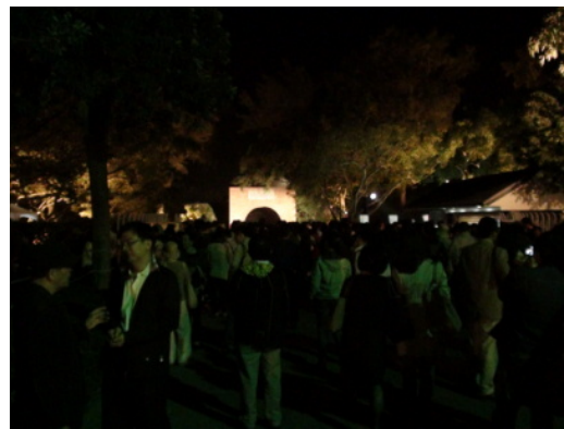
圖 5：引領觀眾的明燈—入口遠景