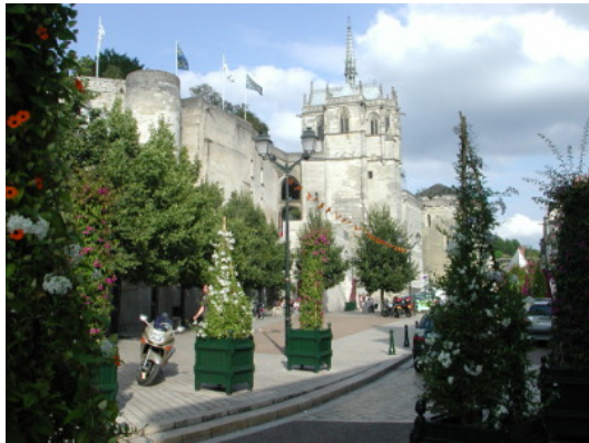
圖 8：安波瓦滋城堡外觀