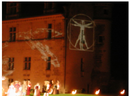
圖 13：安波瓦滋城堡夜間劇的表演