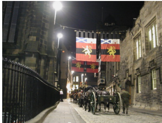
圖 19：等待從城堡入口入場表演的軍樂對騎