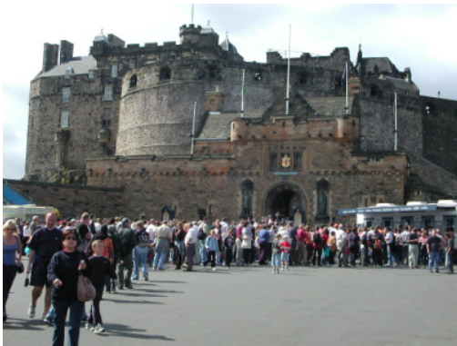
圖 16：愛丁堡城堡外觀

堡(圖 16)，舉辦軍樂節的表演，在城堡內上演軍樂表演，配合風笛哀怨幽悽的聲音，彷彿帶領觀眾穿越時空，來到古代的蘇格蘭王朝。而觀眾席是特意製作的，以城堡內的廣場為表演中心，只留城堡入口，其餘四周架上觀眾席，讓軍樂表演置於觀眾席的中央，意使每一位觀眾都能清楚觀賞表演。(圖 17-19)在表演的同時，還善用燈光來營造表演氛圍