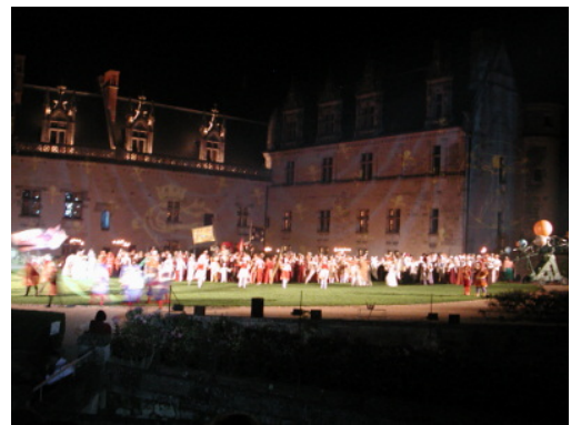
圖 11：安波瓦滋城堡夜間劇的表演