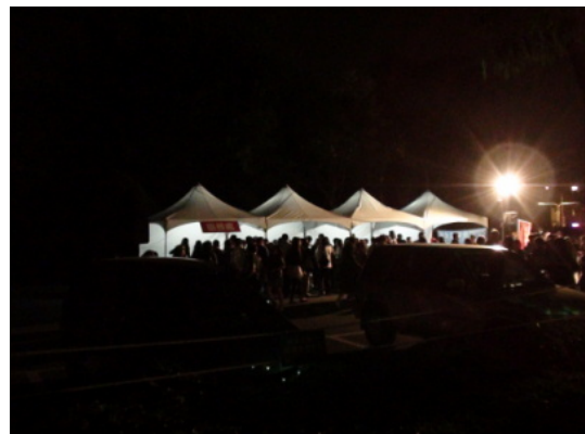
圖 2：昏暗的億載金城的周遭—城牆