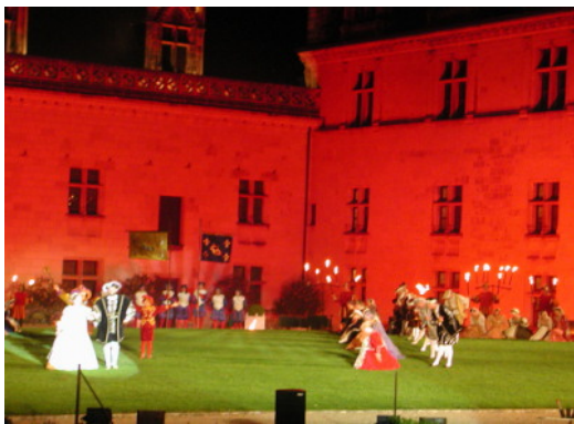
圖 10：安波瓦滋城堡夜間劇的表演畫面之 1 畫面之 2

(圖 14)，但是被安置在觀賞整齣表演的最佳地點。舞台與觀眾席的位置，皆與億載金城相仿，但是安波瓦滋的夜間戲劇座位號碼的編排，以及燈光照明都呈現表演場地該有的樣子。