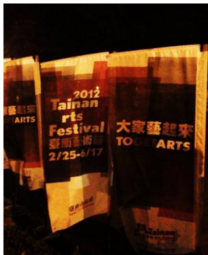
圖 1：「台南藝術節」的口號與專屬旗幟

節目區分為「國際經典藝術」、「臺灣精湛藝術」、「城市·舞台」三大主題，且標榜兼顧在地團隊的扶植以及國際交流的視野，但是實際上細看節目內容，與高雄春天藝術節並無太大差異。 5 如何讓「臺南藝術節」與「高雄春天藝術節」有所區分而有府城的特色，官網則標榜利用府城的文化特色(古蹟)，當成展演空間，以型塑出「臺南藝術節」特有的氛圍。整理「臺南藝術節」72 場的表演活動，將場地安排在古蹟或再生空間的表演情況，如下表：