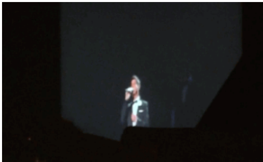
圖 6: 開始出現飛機聲時的畫面